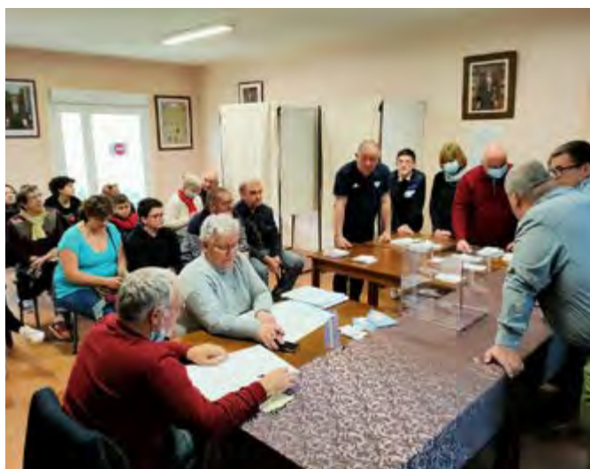
Élections présidentielles, 1er tour, dépouillement.