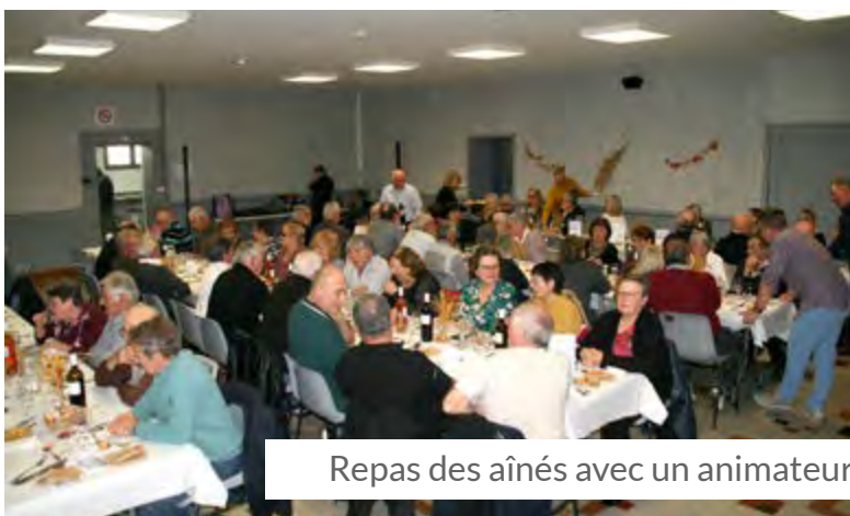
Repas des aînés avec un animateur qui à fait l'unanimité