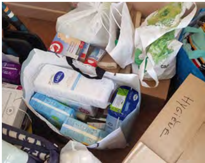
Guerre en UKRAINE : L'appel aux dons pour les Ukrainiens a été entendu.