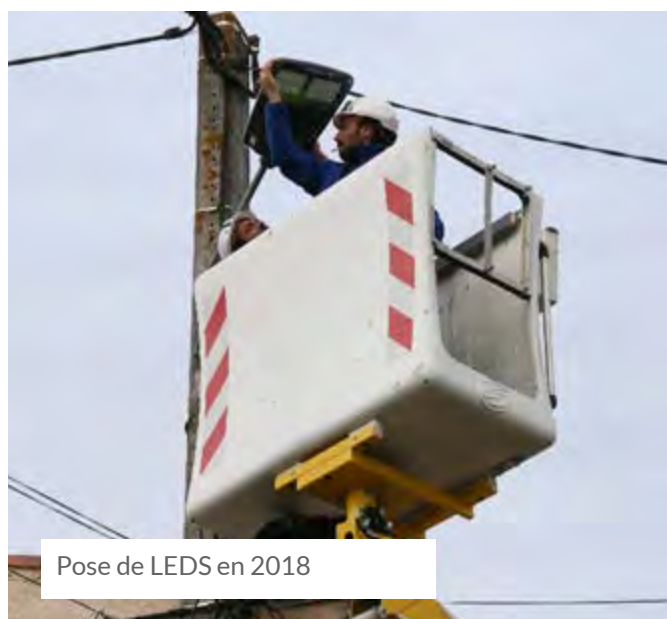
Pose de LEDS en 2018

Depuis l'été 2021, nous vivons une période d'inflation que les plus anciens d'entre nous n'avaient pas connue depuis 1985. Le sujet, ici, n'est pas de débattre des origines de ce phénomène, guerre en Ukraine, planche à billets (qui a beaucoup tourné lors de la crise COVID) ou spéculation.