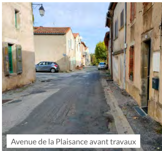
Avenue de la Plaisance avant travaux

Les travaux de taille et d'entretien du village seront aussi effectués.