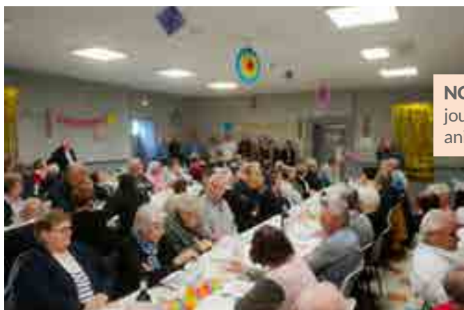
NOVEMBRE : Repas des aînés. Une journée festive avec restauration et animation de qualité.