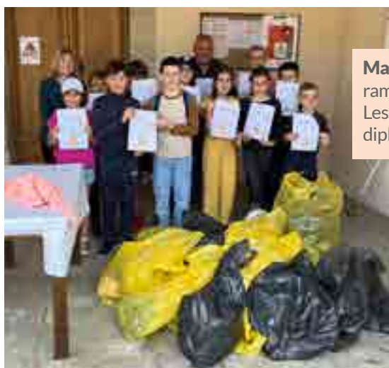
Mai : Le CMJ organise un challenge de ramassage de déchets avec Verdalle. Les enfants avec leur « butin » et leurs diplômes