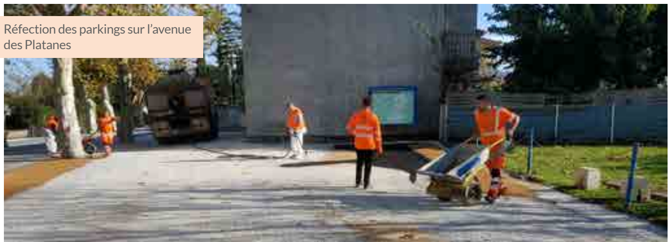
Réfection des parkings sur l'avenue des Platanes

En ce qui concerne la route de la lande, l'avancée du chantier est toujours en attente du feu vert de l'administration.